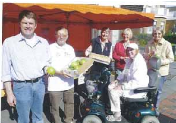
Der alljährliche Mangoverkauf

Unsere Aufgaben als Freizeithelfer sind bunt gemischt: Wir packen einfach mit an, wo Hilfe gebraucht wird. Da gibt es z.B. den jährlichen Mangoverkauf oder den Eine Welt Laden - deren Erlöse Projekten in Burkina Faso zu Gute kommen, oder die Sauberhaltung der Kirchengebäude. In der sehr lebendigen Urlaubergemeinde wird es mit Gottesdiensten, Konzerten, Vorträgen und vielem mehr nie langweilig: