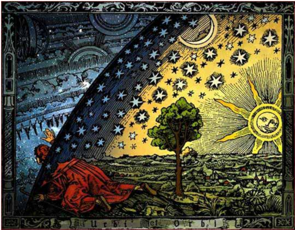
Camille Flammarion, 1888, Holzstich „Wanderer am Weltenrand“

Aus Gründen des Datenschutzes werden personenbezogene Daten in der online Ausgabe unseres Karckenblattes nicht veröffentlicht.