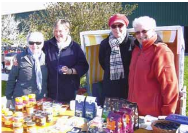
Der Eine Welt Laden der Kirchengemeinde auf Langeoog verkauft seine Produkte im Freien.

Besucher begrüßen, Gesangbücher und Programme verteilen, präsent sein, all dies gehört dazu.